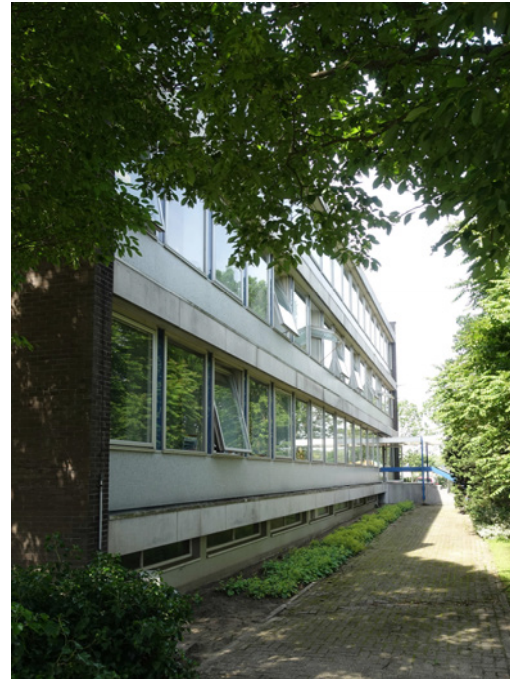
De noordgevel van het kantoorgebouw, 2019, MAB.

Aan de westrand van het terrein staat een kantoorgebouw gebouwd in 1965 bestaande uit drie bouwlagen met een souterrain. Het gebouw volgde in zijn opzet en uitwerking de eerder gerealiseerde gebouwen op het terrein. De kopgevels aan de oost- en westzijde werden rechthoekige schermgevels waartussen de iets lagere lange gevels aan de oost- en noordzijde liggen. Het pand heeft een betonskelet waarbij iedere bouwlaag een uitkragende betonlijst heeft met een borstwering van glasmosaïek. Hierboven een doorgaande reeks van afwisselende vaste ramen en taatsramen, gescheiden van elkaar door smalle met blauw glas afgedekte panelen. Voor de entree ligt een forse betonnen trap met bordes bekleed met hardstenen platen. Het overwegend nog gaaf bewaarde interieur heeft op iedere verdieping een middengangstructuur. De grote ontvangsthal op de eerste bouwlaag kreeg een fraaie vloer van witte grijs geaderde marmere platen. De westwand van deze hal werd bekleed met verticaal geplaatste houten planken. In het souterrain zijn de oorspronkelijke blankhouten archiefkasten op rails nog aanwezig.