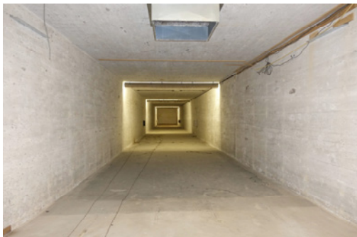
Binnenzijde van de schietbaan, 2019, MAB.