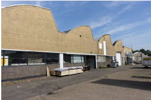
De oostkant van de Shedhal, 2019, MAB.