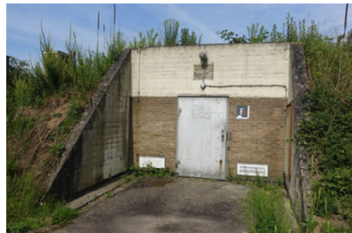
Aanzicht van een bunker met vleugelmuren, 2019, MAB.