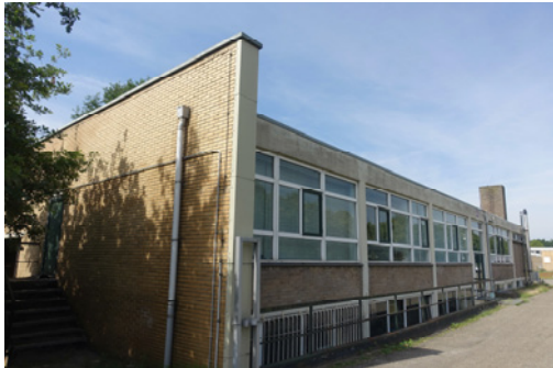
De noordzijde van de schietbanen, 2019, MAB.