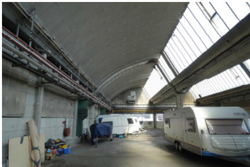
Binnenzijde van de shedhal, 2019, MAB.