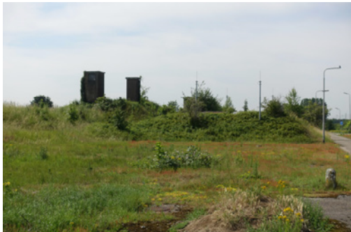
De ventilatieschachten van de schietbanen, 2019, MAB.