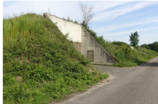
De reeks bunkers aan de oostrand van het Kruithoornterrein, 2019, MAB.